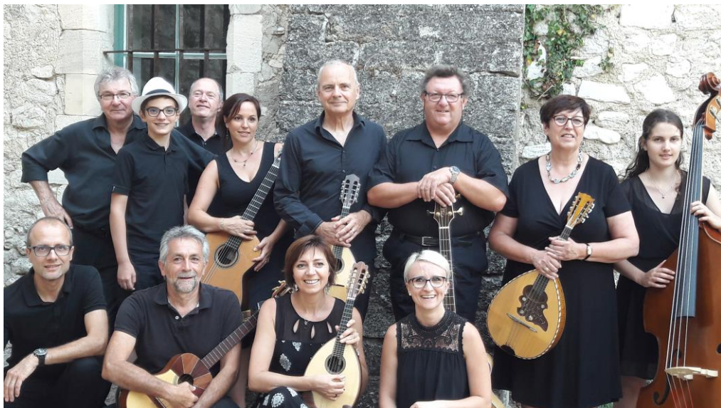
L'orchestre lors de sa tournée en Provence en juillet 2017

L'ensemble des Mandolines Buissonnières, originaire de Lutterbach près de Mulhouse, réunit une douzaine de musiciens et se compose de mandolines, mandoles, guitares, de contrebasses et d'un cuatro (guitare vénézuélienne).